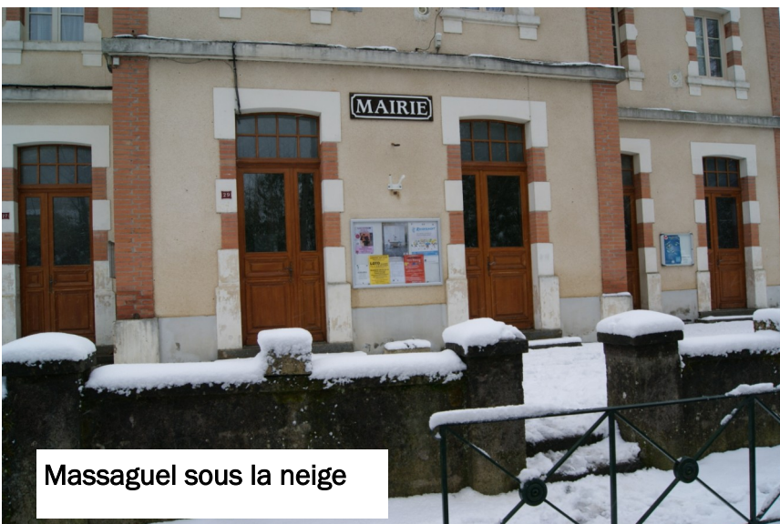
Massaguel sous la neige