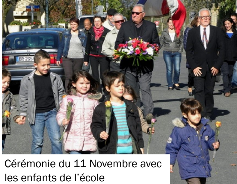
Cérémonie du 11 Novembre avec les enfants de l'école

Les enfants sont en principe ravis de pouvoir s'amuser sur les aires de jeux situées dans nos villages. Celle installée ici, sur la place, à côté de la Vierge, commençait à dater. La municipalité a donc décidé de la remplacer. Depuis, on ne peut que constater qu'elle est vraiment très appréciée et très fréquentée, les enfants de l'école étaient enchantés d'y poser pour la photo . Petit rappel pour dire que cette aire est réservée aux enfants de 2 à 7 ans, sous la responsabilité de leurs parents ou d'accompagnateurs majeurs.