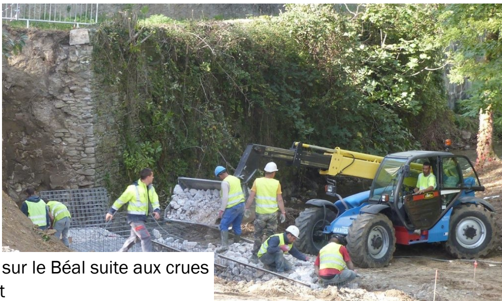
Travaux sur le Béal suite aux crues de juillet