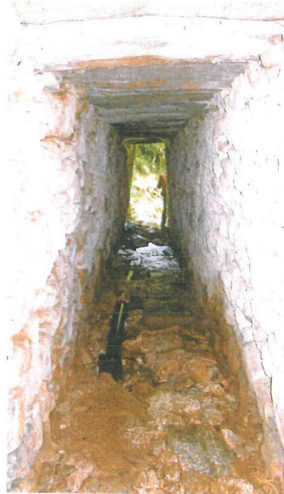
Fig. 7.- Le tunnel d'accès au captage