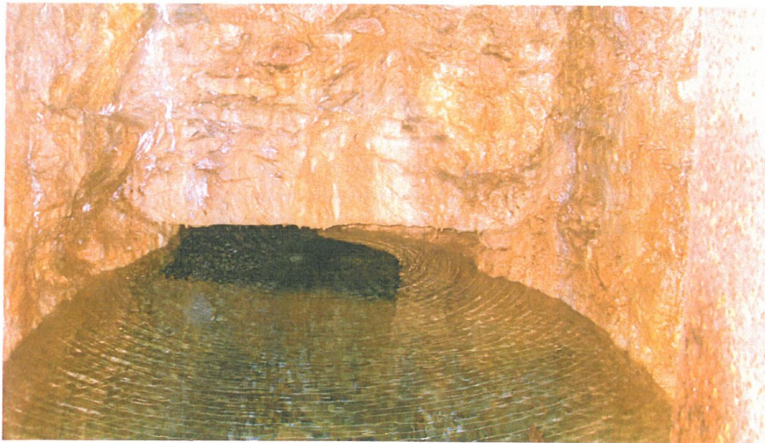
Fig. 8.- L'arrivée des eaux dans le bassin de réception