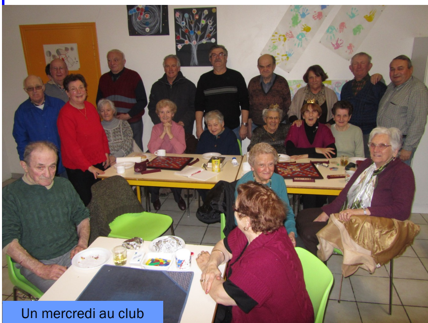
Un mercredi au club