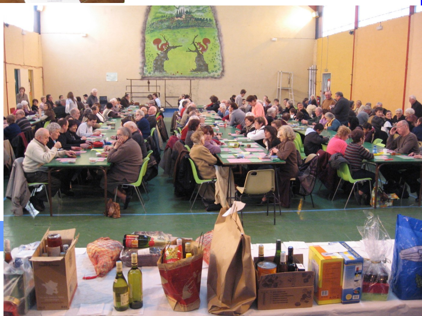
LOTO DU CLUB