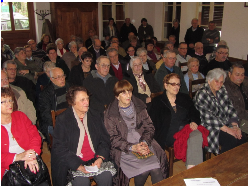
Assemblée Générale du Club

Faisant suite à l'assemblée générale qui a réuni beaucoup de monde, l'élection du bureau a reconduit tous ses membres, et le président a été réélu à l'unanimité, il est bien connu qu'on ne change pas une équipe qui gagne