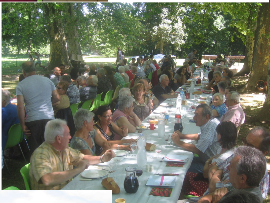
REPAS AU PRADEL