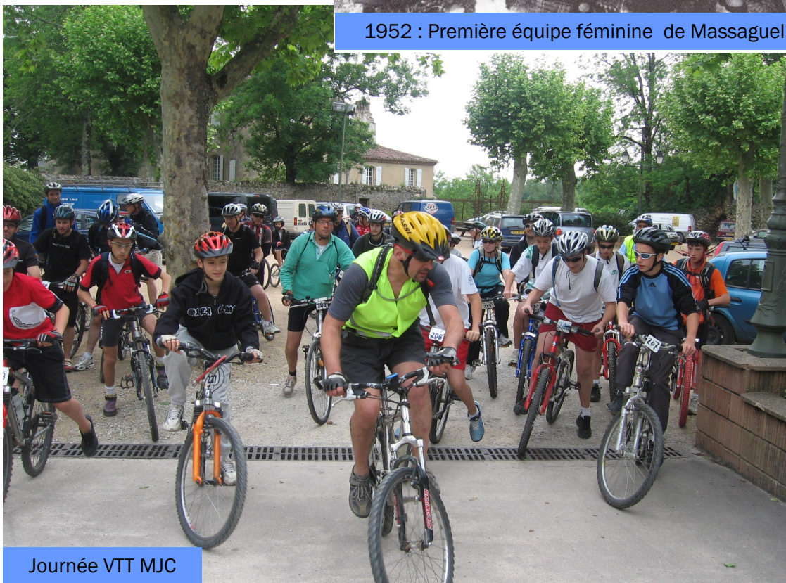
Journée VTT MJC