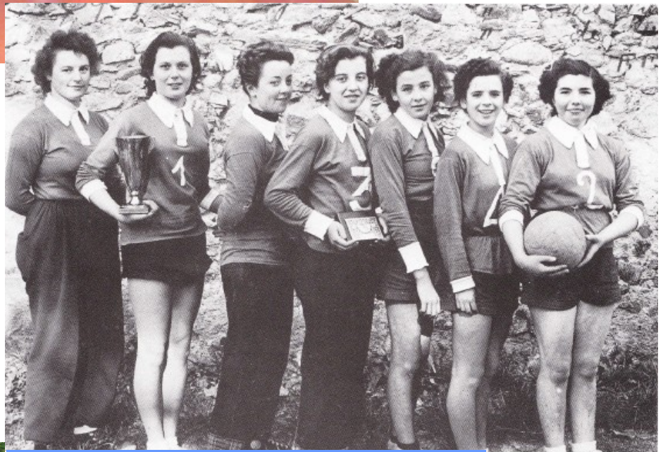
1952 : Première équipe féminine de Massaguel