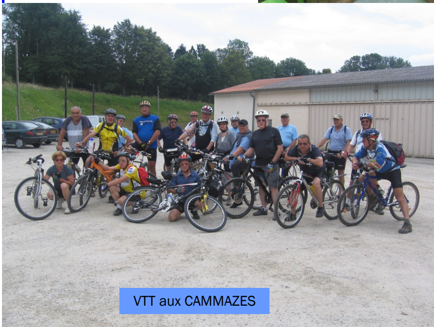
VTT aux CAMMAZES