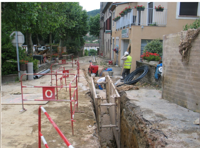
Carrefour du monument