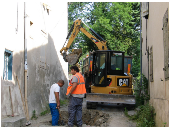
Dans une rue étroite...