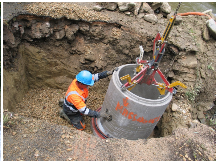
Pose d'un regard