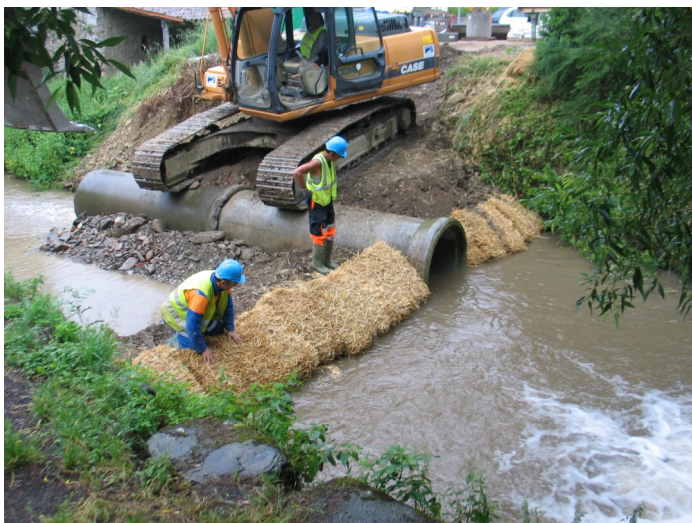
Franchissement du Sant