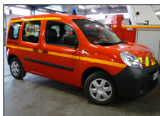
1 véhicule léger