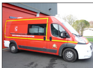
1 véhicule de secours et d'assistance aux victimes