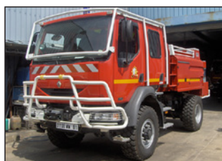
1 camion citerne feux de forêt