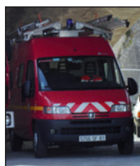
1 véhicule tous usages