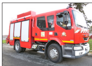
1 fourgon pompe tonne