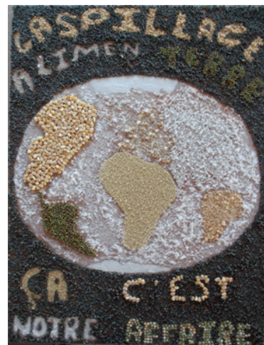
Ecole de Sorèze, classe de M. Gonzalez