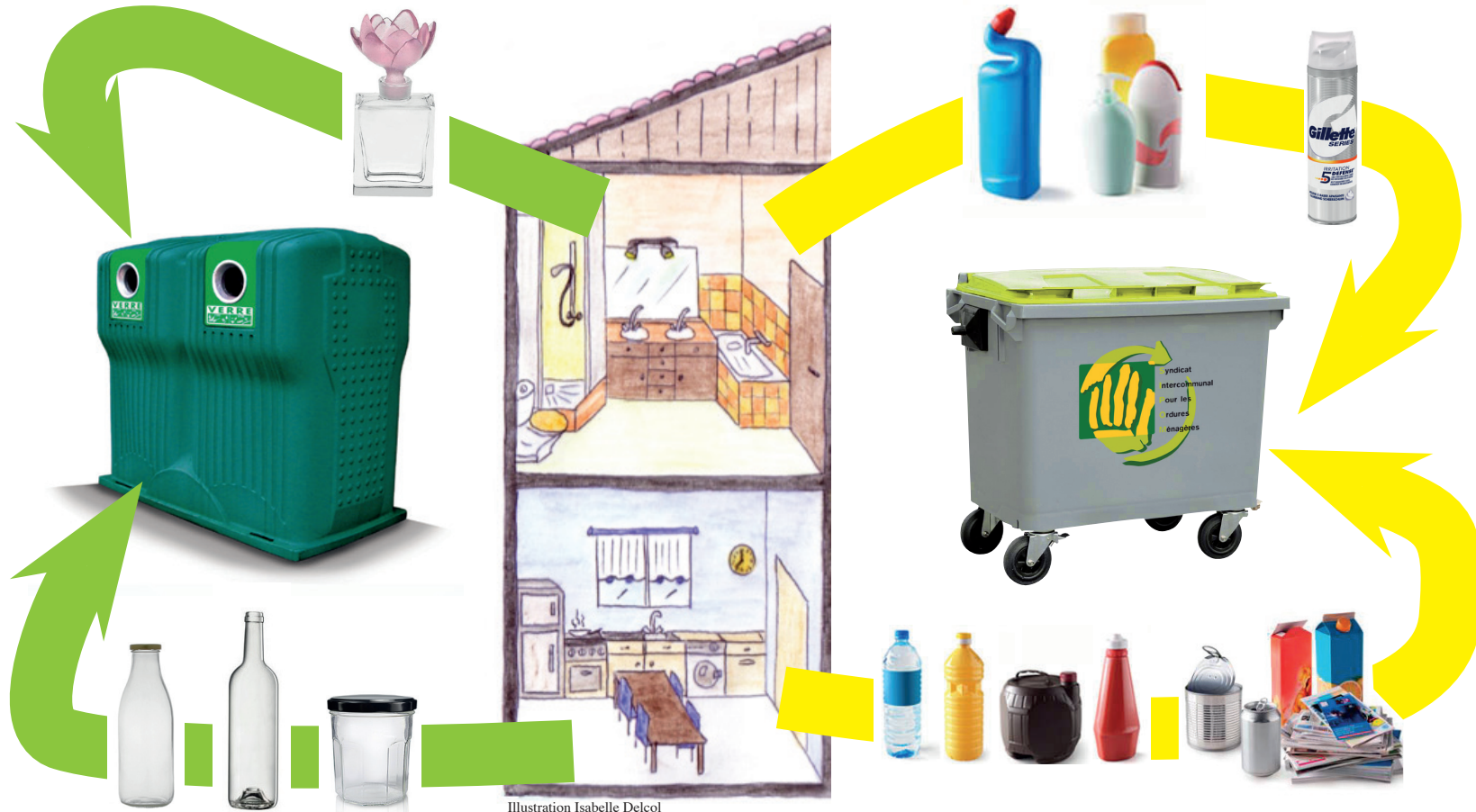
Illustration Isabelle Delcol