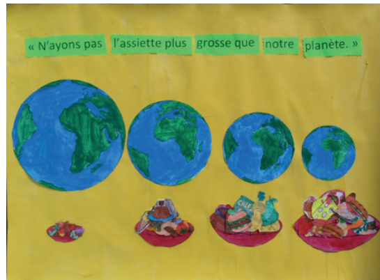
Ecole de Lanta, classe de M. Eychenne

Le jury a dû choisir les 3 affiches les plus représentatives sur une soixantaine d'œuvres.